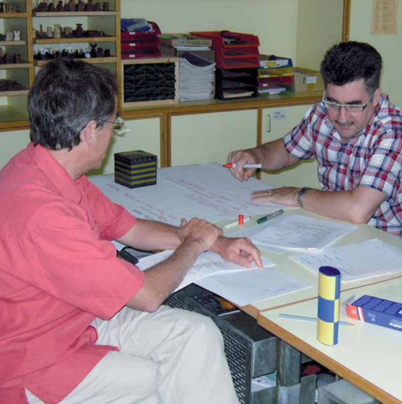
Lehrpersonen der MPS Muotathal