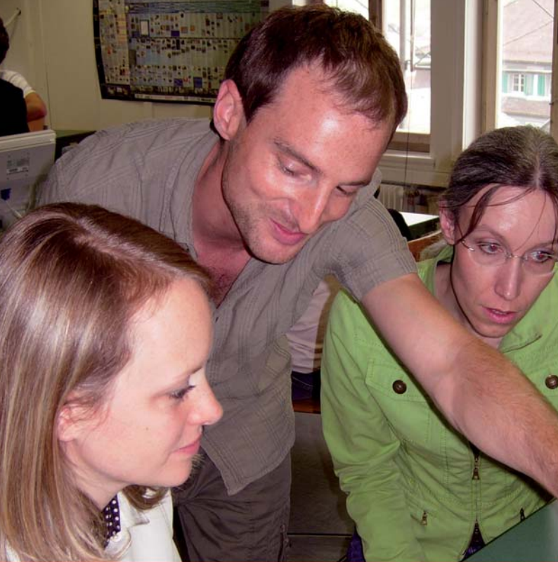
Lehrpersonen der MPS Rothenthurm