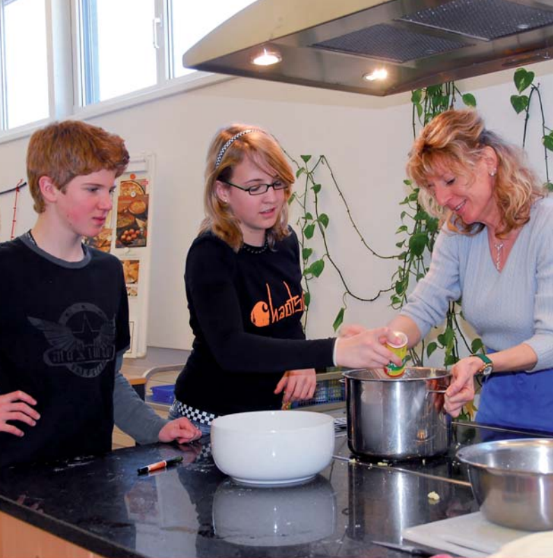
Schülerin/Schüler und Lehrerin der MPS Ingenbohl-Brunnen beim Hauswirtschaftsunterricht