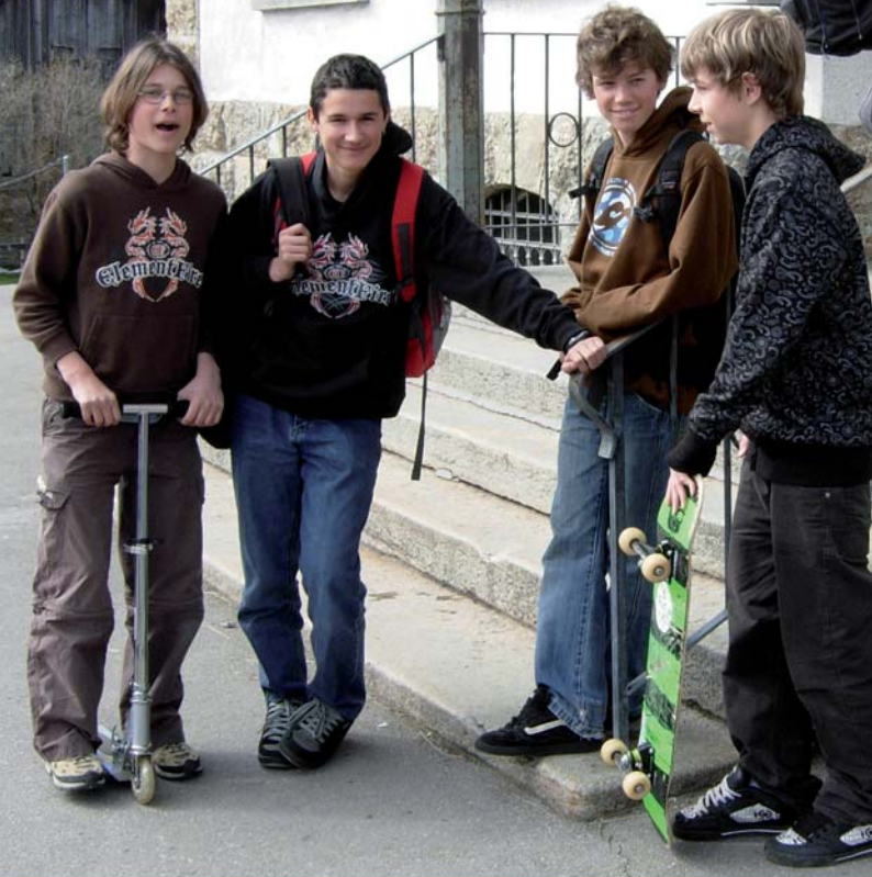
Schüler der MPS Rothenthurm auf dem Pausenplatz