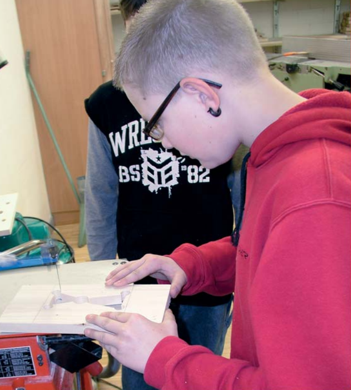
Schüler der MPS Unteriberg beim Werkunterricht