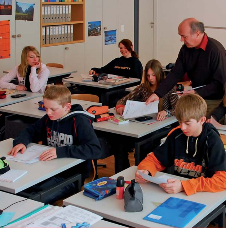
Schülerinnen/Schüler und Lehrer der MPS Schwyz beim Unterricht